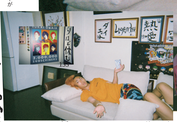
10th Anniversary Book TENKEI

しば お前……そんなことしてたんかおい！ いや、まあその気持ちはわかるが。 てつ 大体スタジオに向かう車で2個くらい思いつくから、半分くらい車内で生まれてるわ。脳の開門がそこなんだよね。 ゆめ 僕はネタの好みに、完成まで練って考えておきたい。未完成のものはまだ出さなくていいやっていう感じで、工場みたいにつくるタイプ。 てつ そこに僕はちょっと寂しさがあったりもするね。昔やってた。思いついて撮る。みたいな勢いがなくなっちゃったっていうのはどうしてもあるから。練られたまともなものばかりになっちゃうと……爆発力を抑えて、継続性に特化してるところを物足りなく感じたり。確実に効率をよくなったから、どっちがいいかってのはわからなけれど。 とし まあ総じて、やりたくねえことはやりたくねえし、やりたいことはやりたいっていうのが、今の形だったら叶うっていう感じではあるかね。 てつ 正直、本当に大変ではあるよ。体力的に死ぬまでこのスタイルで続けられるわけではないから、どこかで終わるとしたらどこなんだらうっていうのは最近思う。徐々に無理になっていくよりも、どこかでちゃんと切り替えようっていうほうが気持ちもいい気がするし。でも、やれるとこまで突っ走るっていうのもそれはそれで美学な気もするし。まだどうしていいかっていうのは決めてない状態だね。